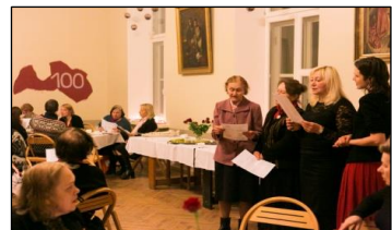
18. novembra svinības

Kristīgie principi diemžēl nav pilnīgi uzplaukuši ikdienas dzīvē un tautas ikdienai bieži vien taisnības, kopības un mīlestības ideāli nav raksturīgi. Baznīcas misija ir tikusi pārāk politizēta un Kristus žēlastības vaigs nav atklājies katram cilvēkam. Daudzi tomēr ir stiprinājušies ticībā un nereti uzticējuši Māras zemes likteni debesu un Latvju zemes karalienei – Aglonas Dievmātei. Viņa kopā ar daudzajiem svētajiem aizbildņiem patiešām var izlūgt svētību Latvijai un mūsu kopīgajam ceļam uz priekšu.