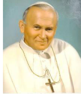
Sv. Jānis Pāvils II 1920 - 2020

Izdots 1979. gada 16. oktobrī kā 1977. gada bīskapu sinodes rosināts apustuliskais pamudinājums Catechesi Tradendae par katehēzes nozīmi un atjaunotni Baznīcā. Pēc Vatikāna II koncila nākas atjaunot kristīgo katehēzi tās saturā un metodēs, ņemot vērā pastiprinātu uzsvaru uz Dieva Vārdu, laju lielāku iesaistīšanos, pedagoģijas attīstību un dažādām laikmeta prasībām.