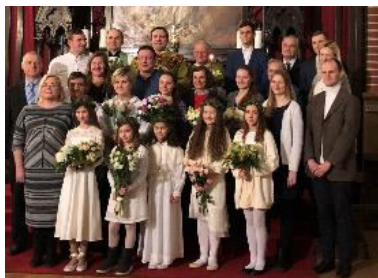
Svētdienas skolas izlaidums 26. janvārī

Vēl viena svētdienas skolas vērtība ir zināšanas, kuras tā sniedz par kristietību. Cilvēkam, kura zināšanas līdz šim ir bijušas visnotaļ ierobežotas, tiek sniegta iespēja izzināt baznīcas vēsturi, kā arī iepazīt Jēzu Kristu. Tas palīdz nākotnē veidot stabilu kristīgo ceļu uz baznīcu.