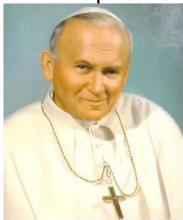
Sv. Jānis Pāvils II 1920 - 2020

Grūtās situācijās būtu jāpiestrādā pie darba organizēšanas, proti, veidot un sakārtot darbu tādā veidā, ka tas sekmētu